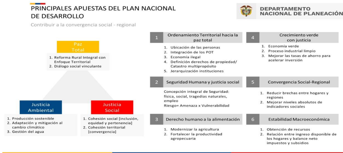
Ilustración 1. Estructura Estratégica-Programática DNP

Para ello, el Departamento Nacional de Planeación (DNP) ha diseñado, como parte de los lineamientos estratégicos del Plan Nacional de Desarrollo 2022-2026 “Colombia, potencia mundial de la vida” , una estructura programática compuesta de tres ejes transversales y seis ejes generales que contienen la apuesta gubernamental que guiarán los cambios que demanda la sociedad colombiana. Los primeros (ejes transversales) son: Paz Total, Justicia Ambiental y Justicia Social; mientras que los segundos (ejes estratégicos generales) se han denominado: 1. Ordenamiento Territorial hacia la paz Total; 2. Seguridad Humana y Justicia Social; 3. Derecho Humano a la Alimentación; 4. Crecimiento verde con justicia; 5. Convergencia social-regional; 6. Estabilidad Macroeconómica.